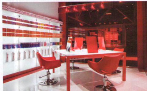
Sopra, il salone open space delimitato da due grandi aree cubiche. Una comunicazione che esprime vicinanza, efficacia, semplicità.

Un ambiente che bene ha espresso i principali valori della marca: vicinanza, efficacia e semplicità. Centrali nell'area tecnica del salone, le colorazioni Matrix: Socolor.beauty , con le proposte colori naturali calde, Color Sync , con i nuovissimi biondi pastello, Prizms.plus , la colorazione diretta iper-brillante e il più recente lancio Colorgraphics2 , esclusivo sistema professionale che schiarisce, tonalizza e condiziona in un unico step, in massimo 10 minuti sotto fonte di calore. E non poteva mancare uno spazio dedicato alla proposta Matrix Men , che testimonia quanta attenzione vada dedicata alla bellezza maschile all'interno del mercato professionale.